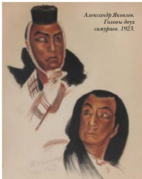
Александр Яковлев. Головы двух самураев. 1923.

Сейчас в Музее личных коллекций экспонируют коллекцию искусства Михаила Барышникова, которую в прошлом году показывали в нью-йоркской ABA Gallery.