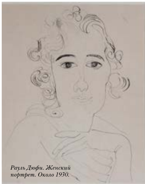
Рауль Дюфи. Женский портрет. Около 1930.

днако в Музее личных коллекций время от времени появляются весточки от знаменитого танцовщика и хореографа. Все объясняется просто: выезжая за границу, с ним общается нынешний президент ГМИИ им. Пушкина Ирина Александровна Антонова. Именно благодаря ей в 2005–2006 году в Москве показывали выставку фоторабот знаменитого танцовщика и 28 акварелей Максимилиана Волошина, которые Барышников передал в дар Отделу личных коллекций Музея.