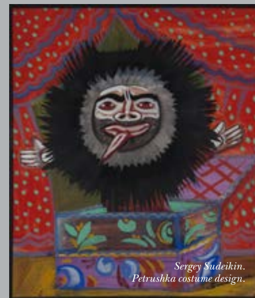
Sergey Sudeikin. Petrushka costume design.

Currently the Museum of Private Collections is exhibiting Mikhail Baryshnikov's art collection, which was shown at the ABA Gallery in New York last year.