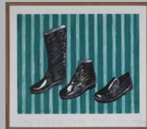
David Salle. Curtain design for The Molino Room. 1986.

The exhibition runs through January 19, 2014