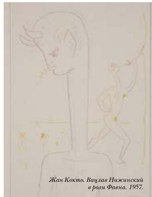
Жан Кокто. Вацлав Нижинский в роли Фавна. 1957.