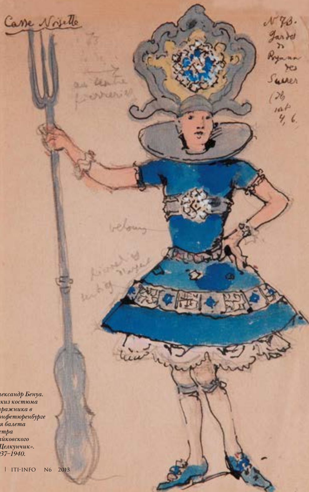
Александр Бенуа. Эскиз костюма стражника в Конфетюренбурге для балета Петра Чайковского «Щелкунчик». 1937–1940.