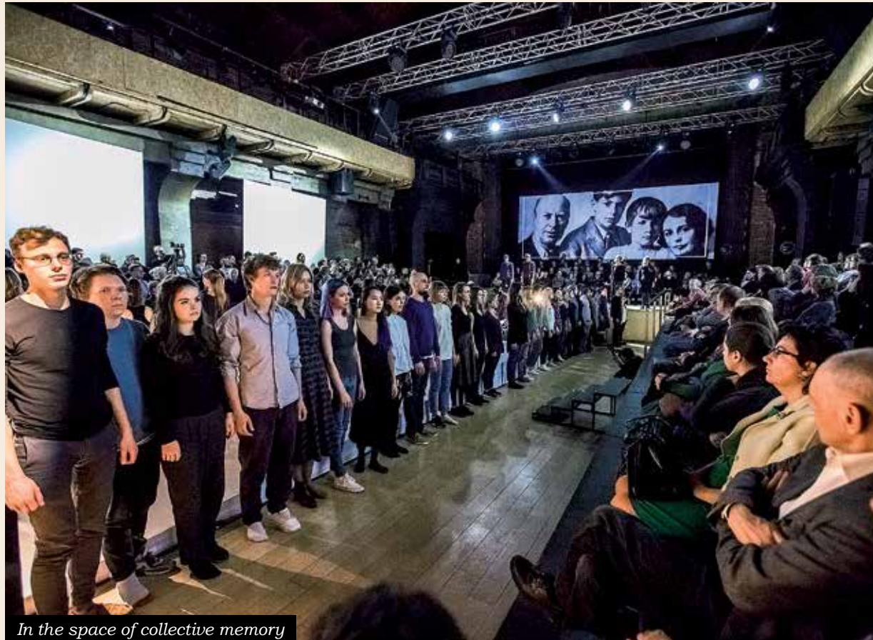
In the space of collective memory