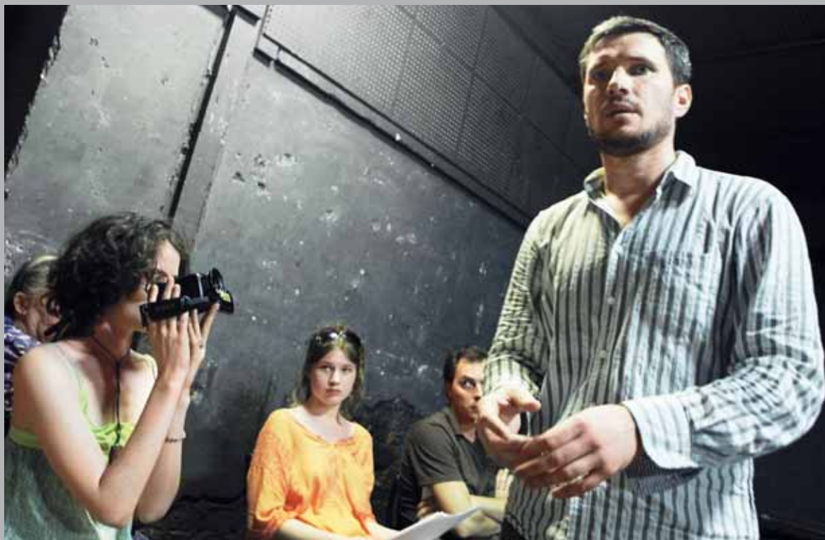
The formula “while playing the villain look for the good in him” was cast aside as useless.