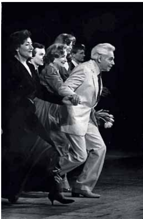
Сцена была для Аркадия Райкина лучшим лекарством. Бывало, уговорив врачей по дороге в больницу «на минуточку» заехать в театр, он отыгрывал спектакль.

Как ткань для портного. Он мог заказать один и тот же монолог разным авторам, уверив каждого, что только он в состоянии понять райкинский замысел. Мог переписать или исправить до неузнаваемости их тексты или «сшить» новую миниатюру из разных «лоскутов» – разных авторов. «Это сказал Райкин», не сомневалась публика.