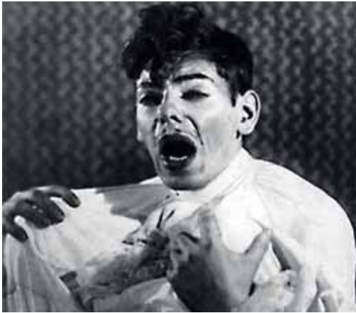
Аркадий Райкин вошел в пятерку лучших комиков мира.