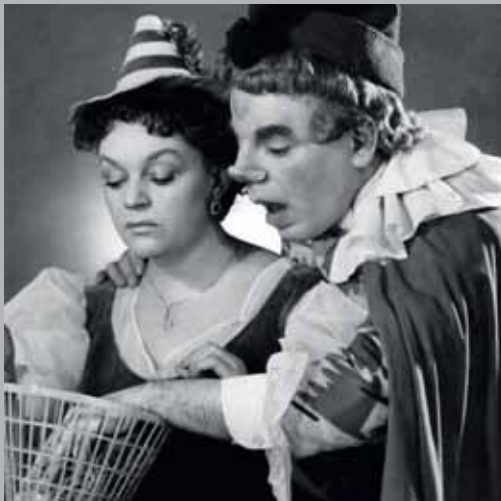
Arkady Raikin with his wife and partner on stage Ruff Roma. They lived together for more than 50 years.

talent in order to appear laid back and businesslike. It has long been his dream to have Zoshchenko become their theatre's author, but he also understood that Zoshchenko's literature ascended to a different level. Now, however, the time for stylistic subtleties has passed – the writer was literally being deprived of his livelihood. And that is how Zoshchenko's miniature "Good Morning."became part of the theatre's repertoire.