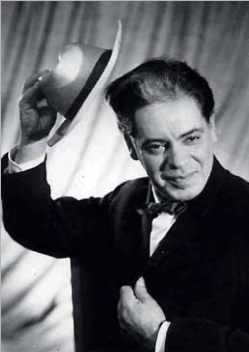
Raikin ridiculed Soviet bureaucrats in English, and the British roared with laughter, recognizing their own from his descriptions.

The Theatre of Miniatures was blatantly nonpartisan. There were never enough members of the CPSU to create a party organization (the minimum required number was three). Nevertheless, the “richness of Lenin's ideas.” was likewise put to good use. Thus, in the 1960s the theatre put forth a production of “Plus-Minus.” whose authors were Zhvanetsky, Likhodeev and... Lenin. Every satirical attack was supported by quotes from Ilyich's collected works with reference to volume and page number.