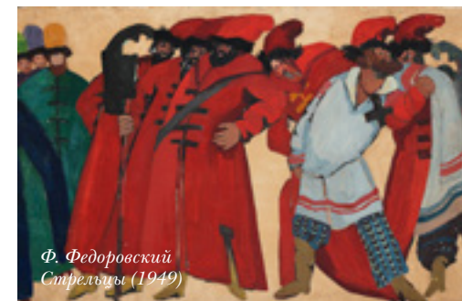
Ф. Федоровский «Стрельцы» (1949)

Н а экспозиции Головина сенсация: впервые в Москве выставлены костюмы к легендарному «Маскараду», выпущенному Мейерхольдом в 1917 году. Долгое время эти вещи считались утраченными, и лишь в середине 1990-х они были найдены и атрибутированы в Александринском театре.