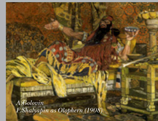
A. Golovin F. Shalyapin as Olophern (1908)

Incidentally, "The Maid of Pskov" with Golovin's set design continued to run at the Bolshoi theatre even after the Revolution for about ten more years. After that another artist, Fedor Fedorovsky, presented his own stage solution. His theatre sketches can be viewed by going one floor down from the gallery halls where Golovin's works are exhibited. The gallery at Krymsky Val is currently showing