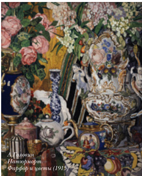
А. Головин Натюрморт. Фарфор и цветы (1915)

ставлены работы Головина, спуститься этажом ниже. Сейчас на Крымском Валу проходит первая монографическая выставка Федоровского.