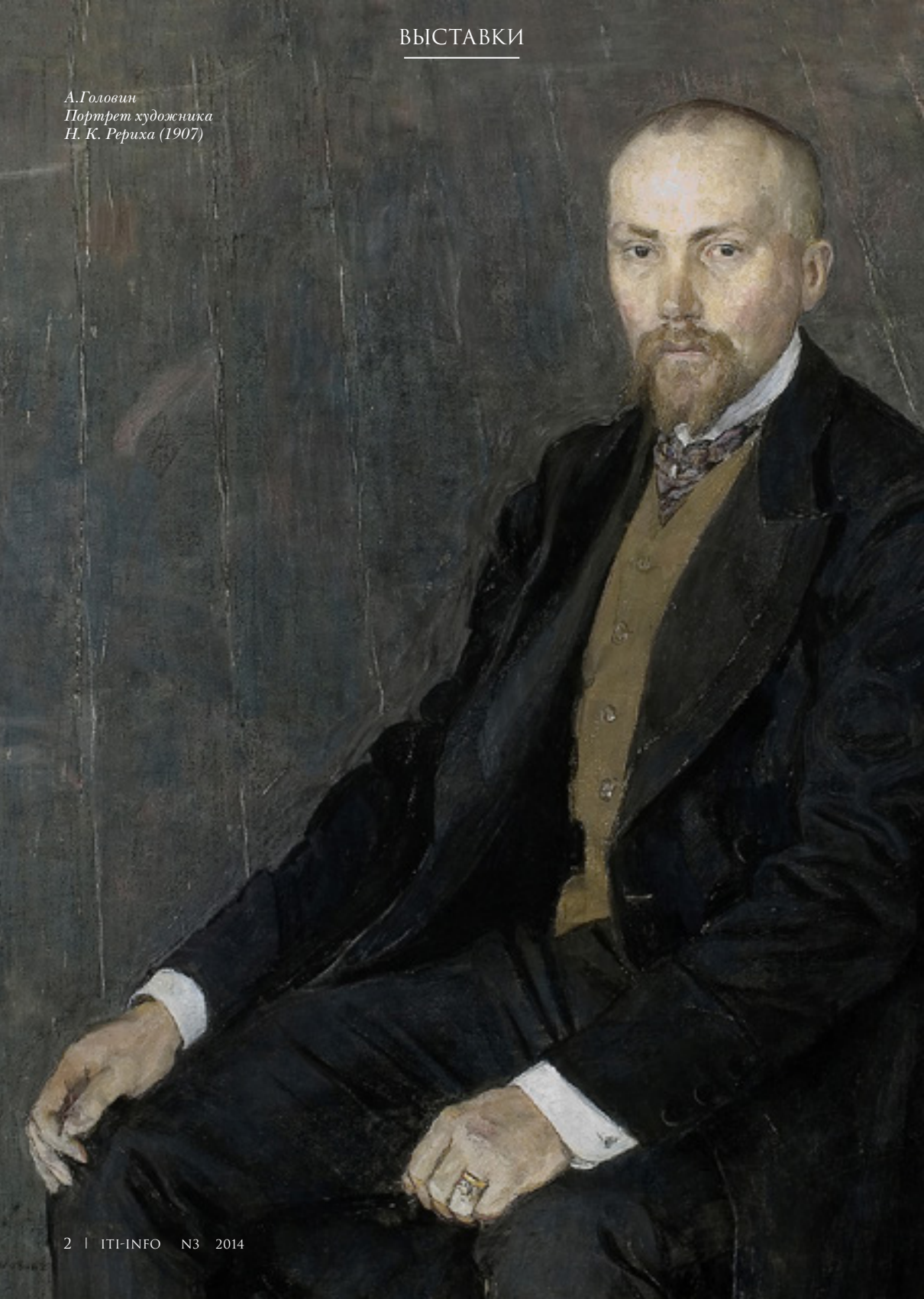
А. Головин Портрет художника Н. К. Рериха (1907)