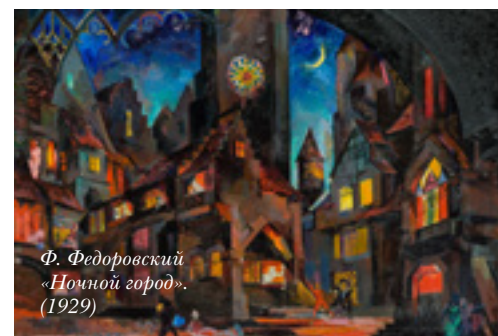
Ф. Федоровский «Ночной город». (1929)

Говорят, что век спектакля короток и после него ничего не остаётся – только память да записки критиков и мемуаристов. Но вот смотришь на белые воздушные сценические облачения из постановки оперы «Орфей и Эвридика» 1911 года – и ощущаешь очарование спектакля. На одном из костюмов