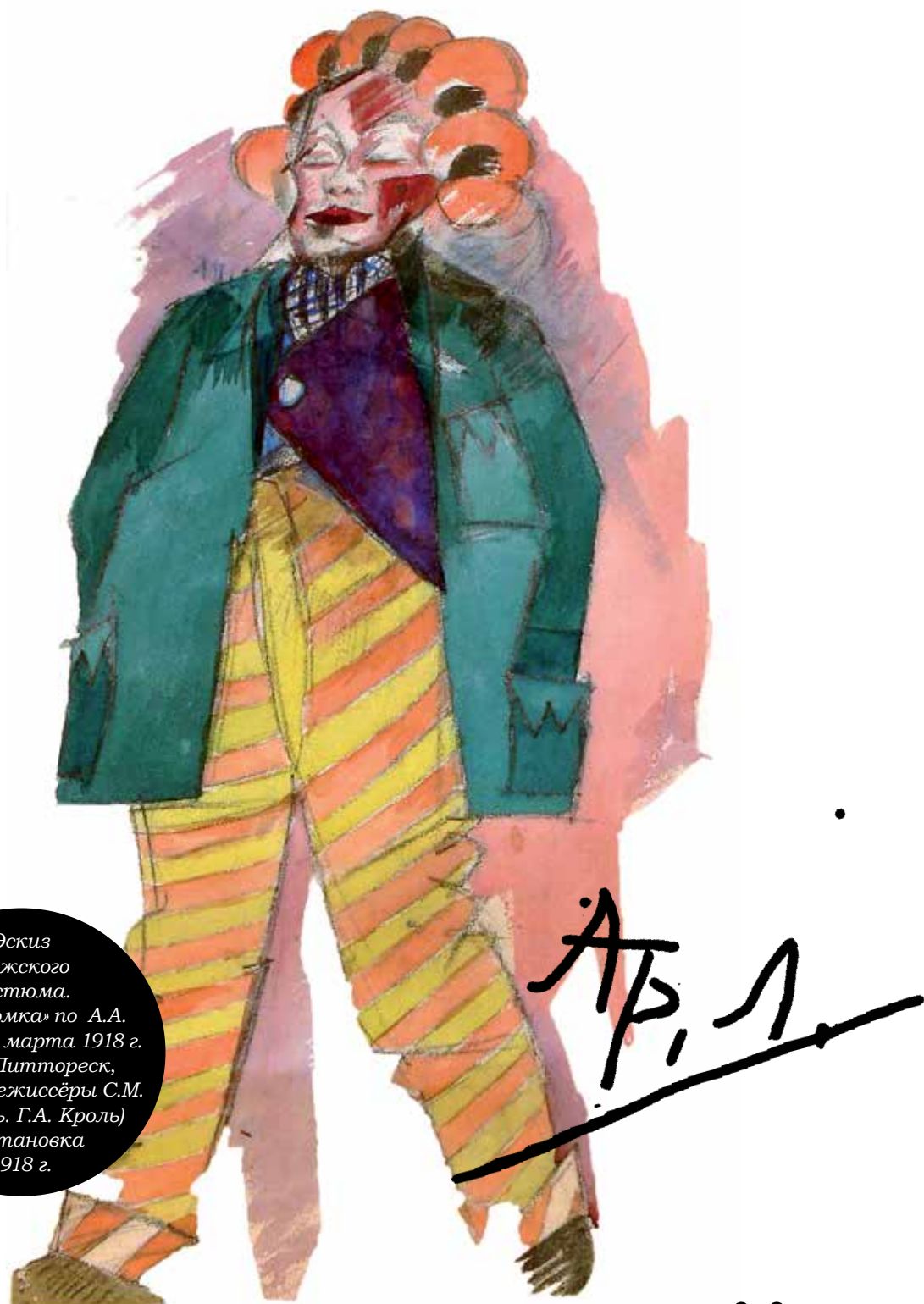
Эскиз мужского костюма. «Незнакомка» по А.А. Блоку. (14 марта 1918 г. Кафе «Питтореск», Москва. Режиссёры С.М. Вермель, Г.А. Кроль) Постановка 1918 г.