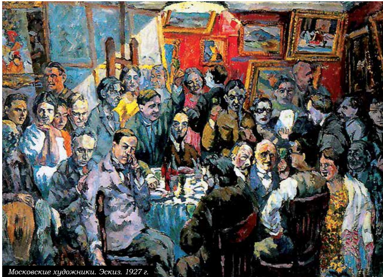
Московские художники. Эскиз. 1927 г.

Одной из лучших театральных работ Аристарха Лентулова стала опера «Сказки Гофмана», поставленная Фёдором Комиссаржевским в Театре-студии при Художественно-просветительном совете рабочих организаций в 1919 году. Актёр Игорь Ильинский так отзывался о «Сказках Гофмана»: «Спектакль этот входит в число тех немногих сценических явлений, виденных за мою жизнь, за которые можно беззаветно любить театр». Коллега Ильинского Михаил Жаров вспоминал: «Это был чисто оперный спектакль, но едва ли не главное место в нём занимал художник А. В. Лентулов – «наш сезанист», как мы тогда его называли. Он оформил спектакль в духе живописи «кубистов». Реальный по форме, рояль на сцене ломался причудливо раскрашенными плоскостями. Костюмы тоже были разрисованы линиями, которые подчеркивали не красоту человека, а, наоборот, ломали и деформировали человеческую фигуру. Береты какой-то странной формы придавали голове причудливые угловатые линии, грим подчёркивал нереальность лица. Надо сказать, что к «Сказкам Гофмана» такое ирреаль-