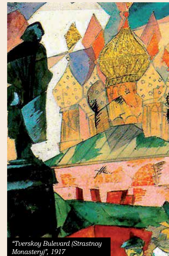
“Tverskoy Bulevard (Strastnoy Monastery)”, 1917

When working on theatre productions, Lentulov collaborated with Vladimir Mayakovsky, Vladimir Nemirovich-Danchenko, Alexander Tairov, Serafima Birman... “All of my productions are an expression of my art principles on stage,” the artist himself once said. Audiences can verify the truth of his words at the exhibition halls of the Bakhrushin Museum’s main building where they can view a collection of his theatre work and artwork side by side. The exhibition will run through August 27.