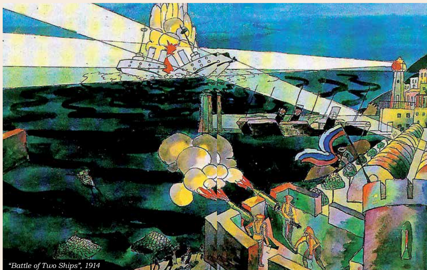
“Battle of Two Ships”, 1914

T he halls of the Bakhrushin Museum accommodate Lentulov’s paintings and his graphic art, and many of the exhibits are associated with theatre. Here they display over 70 costume sketches, as well as photographs of the productions that the artist was working on and their related playbills and programmes. As well as the set model for the opera “The Demon”, staged in 1919 by Alexander Tairov at the Bolshoi Theatre subsidiary. In 1925, this model, along with costume sketches that Lentulov created for the production, was awarded the Grand