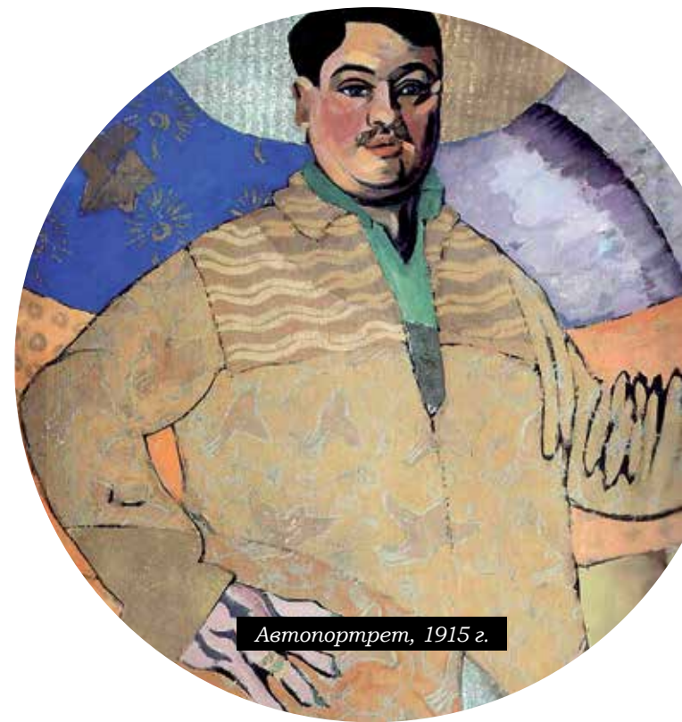
Автопортрет, 1915 г.

В залах Бахрушинского музея разместились картины Лентулова и его графика, причём многие экспонаты связаны с театром. Здесь показывают больше 70 эскизов костюмов, а также фотографии спектаклей, над которыми работал художник, афиши и программки к ним. А ещё – макет декорации к опере «Демон», поставленной в 1919 году Александром Таировым в филиале Большого театра. В 1925-м этот макет вместе с эскизами костюмов к спектаклю, вы-