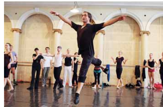
Ирек Мухамедов на репетиции

В то же время некоторые из словенских артистов тоже остаются за границей. Но из-за поддержки, которую оказывают исполнительским видам искусства словенское Министерство культуры и многочисленные муниципальные органы, желающих играть у себя дома, становится все больше. Мы все глубоко надеемся, что сумеем сохранить этот благоприятный статус, несмотря на настоящую экономическую ситуацию. Недавние успешные гастроли Младинского театра с постановками «Эда – история братьев Русьян», «Амадо Мио» и «Преступление и наказание» (Польша; Иберо-американский фестиваль театра в Боготе, Экспо-2010, Каир), Словенского национального театра драмы Любляны с «Орестеей» (Международный фестиваль древнегреческой драмы на Кипре), Мини Театра Любляны с «Макбетом после Шекспира» (Театральный фестиваль в Гаване, Театральная олимпиада в Сеуле), а также премия японского центра международного института театра (МИТ) и премия Учимуры МИТ ЮНЕСКО, которые получил Словенский национальный театр Марибора за постановку пьесы «Ветер в соснах» – вот лишь небольшая часть ярких событий в театральной жизни Словении.