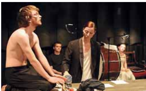
«Ветер в соснах» «Wind in The Pines» по пьесе ????. (Словенский национальный театр драмы в Мариборе)