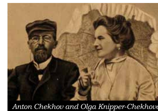
Anton Chekhov and Olga Knipper-Chekhova

People, who had contact with Knipper, noted her exceptional upbringing and innate sense of tact, as well as her emotional responsiveness and finesse. There were, however, also moments of daringness in Olga Leonardovna's life, when she could dance on top of a baby grand piano or pour liqueur on top of some important but