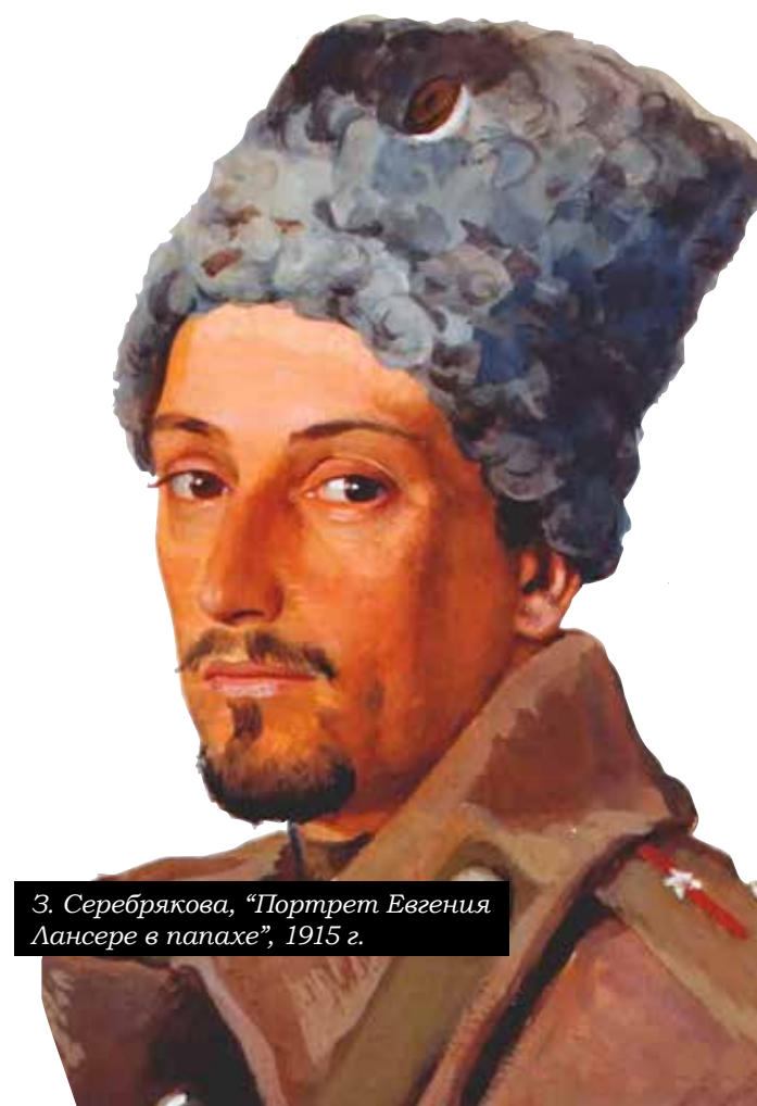
З. Серебрякова, «Портрет Евгения Лансере в папахе», 1915 г.

Но что самое поразительное, когда после революции почти все его коллеги по объединению «Мир искусства» и ближайшие родственники (в том числе младшая сестра Зинаида Серебрякова и Александр Бенуа) уехали из России,