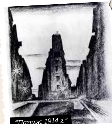
«Париж 1914 г.»