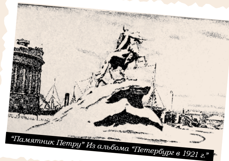
«Памятник Петру» Из альбома «Петербург в 1921 г.»