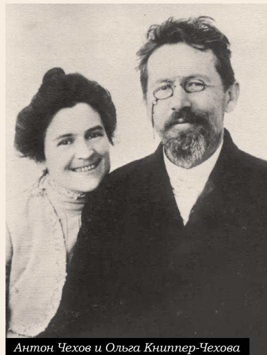
Антон Чехов и Ольга Книппер-Чехова

Увы, их любовный роман до и даже после заключения брака протекал в основном в письмах. Ведь Ольга Леонардовна «до зарезу» нужна была Художественному театру, поэтому не могла надолго отлучаться из Москвы. А больному туберкулезом Чехову на пользу шёл морской воздух Ялты. Кроме того, идеалом писателя была «женщина-луна», которая, по его собственному выражению, «появлялась бы на его небосклоне не каждый день». Вопреки мнению коллег и родственников писателя, обвинявших Книппер в том, что она бросила супруга, разлуку с женой Чехов переносил легче, чем она. А Ольга терзалась, что не может быть рядом с ним.