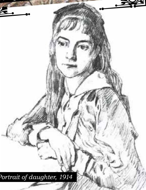
Portrait of daughter, 1914