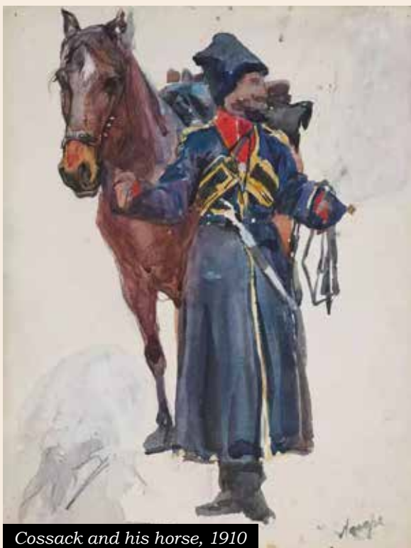
Cossack and his horse, 1910