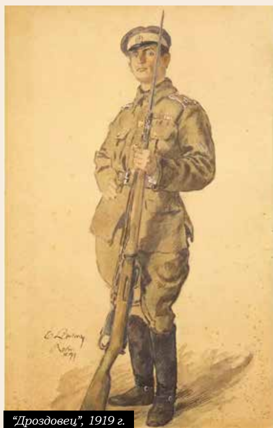
«Дроздовец», 1919 г.

They wrote over eight hundred letters to each other. Their marriage lasted only three years, and then Anton Pavlovich died. Knipper-Chekhova survived her husband by 55 years. She had her love interests, but she never married again. She admitted, "I cannot imagine anyone in Anton's place..."