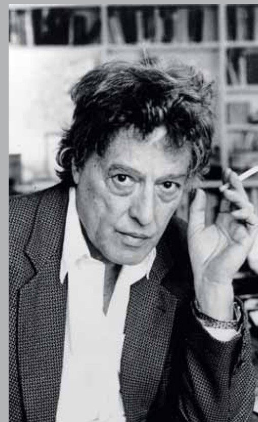
Тому Стоппарду понравилась постановка «Берега утопии» в РАМТе, и он передал этому театру права на постановку другой его пьесы «Рок-н-ролл»