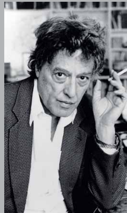
Tom Stoppard liked the production of “The Coast of Utopia”, and he conveyed the right to stage his another play “The rock-n-roll”.