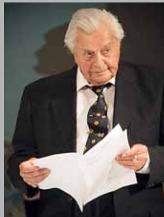
93-летний Юрий Любимов пополнил ряды театральных олимпийцев.

была учреждена в 1985 году в маленьком старинном Таормине, гордящимся своими достопримечательностями – близостью к вулкану Этна, а также греческим и римским театрами. Первыми лауреатами стали Ариан Мнушкин с ее Театром дю Солей и греческая актриса Мелине Меркари. Уже на следующий год премию взял под свое крыло Евросоюз, а сама она обзавелась «дочкой» - премией «Новая театральная реальность», у которой ниже денежный эквивалент, но не престиж. Первым лауреатом «Новой театральной реальности» стал Анатолий Васильев. Со временем премия «Европа – театру» потеряла поддержку сицилийских властей, но не вес в мировом театре. Теперь она меняет «места дислокации», в иные года из-за отсутствия денег не вручается совсем. Но список театральных «олимпийцев» пополняется новыми бесспорными именами - Лев Додин, Питер Брук, Джорджо Стрелер, Хайнер Мюллер, Роберт Уилсон, Пина Бауш, Эймунтас Някрошюс, Гарольд Пинтер, Кристиан Люпа, Оскар Коршунувас, Алвис Херманис, Кристоф Марталер. Что лишний раз доказывает: понятие «гамбургского счета» еще не утратило свой смысл.