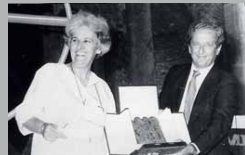
Ariane Mnouchkine, the creator of the Theatre du Soleil was the first laureate of the Europe Theatre Prize