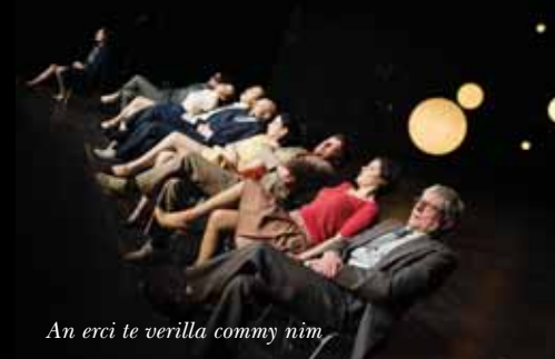
An erci te verilla commy nim