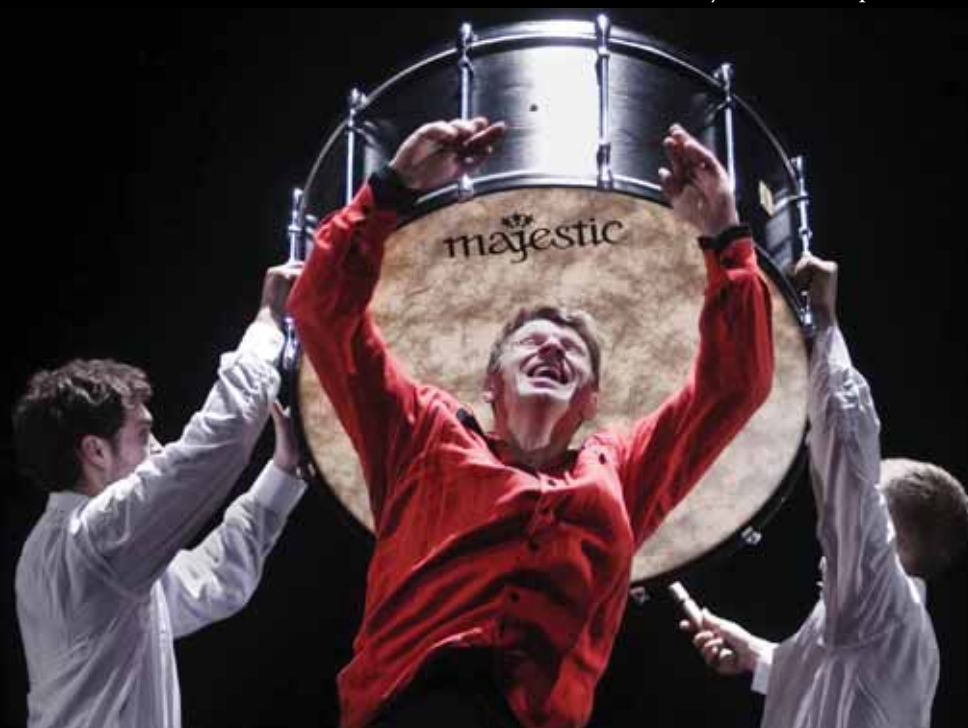
An erci te verilla commy nim