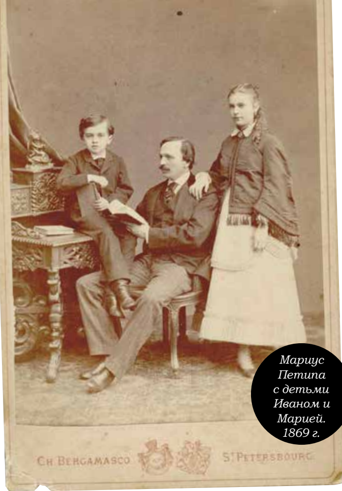
Мариус Петипа с детьми Иваном и Марией. 1869 г.

шла как заведённая машина. Этому немало способствовало и то, что многие из ансамблевых построений балетмейстер разрабатывал дома. На столе он по-разному компоновал фигурки, изображающие танцовщиц и танцовщиков, и записывал наиболее удачные вариации. Во многом благодаря этим домашним заготовкам, свои балеты Петипа ставил в рекордно короткие сроки – за полтора-два месяца.