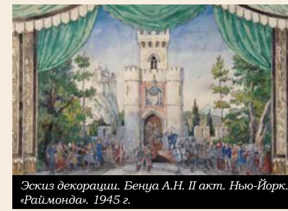
Эскиз декорации. Бенюа А.Н. II акт. Нью-Йорк. «Раймонда». 1945 г.

“Recalling my career in Russia, I can say that it was the happiest time of my life ... May God bless my second home I love with all my heart,” Petipa wrote in his memoirs in the old age.