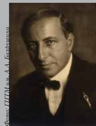
Molore ea acillaoreet velis atueril eros dolobortie faci elendrem zzriure estie facinci duiipit