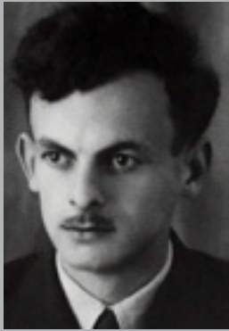
BULAT OKUDZHAVA Page XX