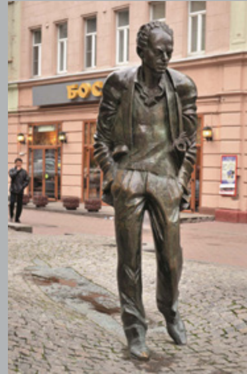
SERGEI PROKOFIEV Page XX

Bulat lived without his parents from the time he was 12 years old: his father, a known political figure, was executed by a firing squad in 1937; his mother spent 17 years in labor camps. Okudzhava joined the Party following the 20th Congress of the CPSU (Communist Party of the Soviet Union) and the rehabilitation of all the