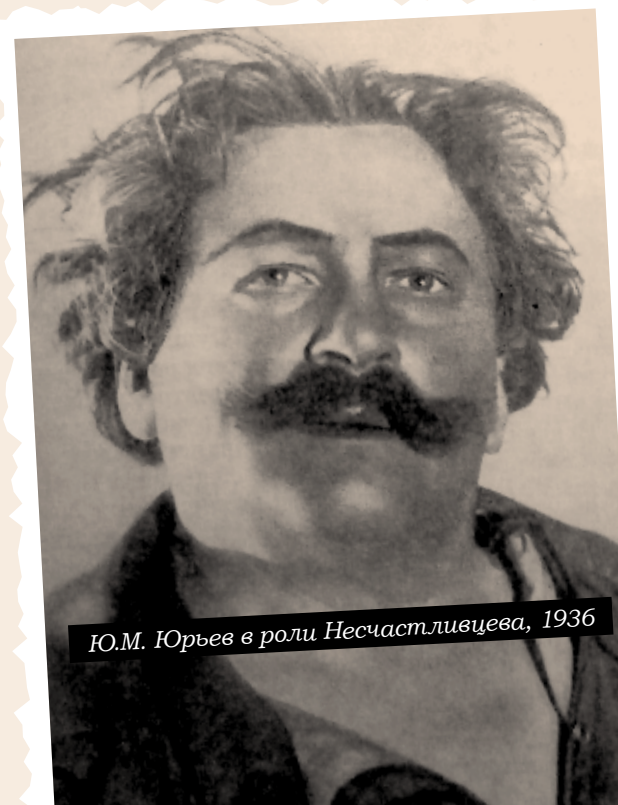
Ю.М. Юрьев в роли Несчастливцева, 1936

Правда, привычки к налаженному быту не мешали Юрьеву всю жизнь работать в поте лица – часто в буквальном смысле слова: после его чтецких концертов рубашки артиста приходилось выжимать. А в годы Великой Отечественной войны Юрьев иногда выступал по четыре раза в день, работая без передышки, хотя в то время ему было уже за семьдесят. Около полувека актёр вёл преподавательскую деятельность. Самый известный его ученик – Михаил Царёв – позже возглавил Малый театр.