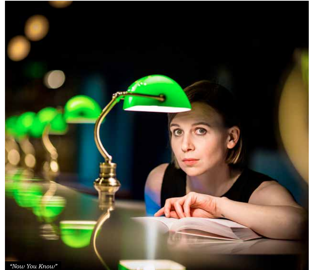
"Now You Know"