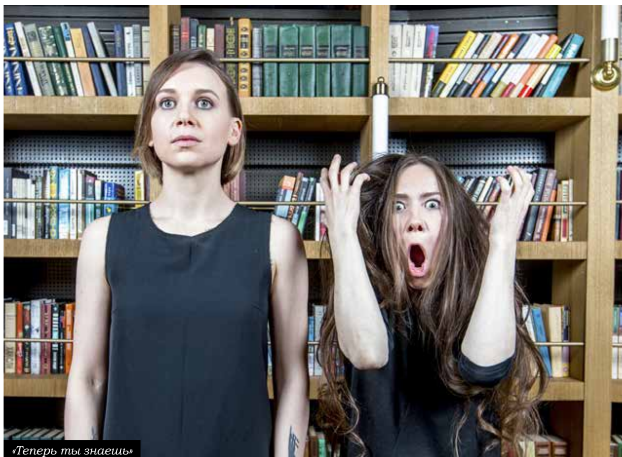
«Теперь ты знаешь»