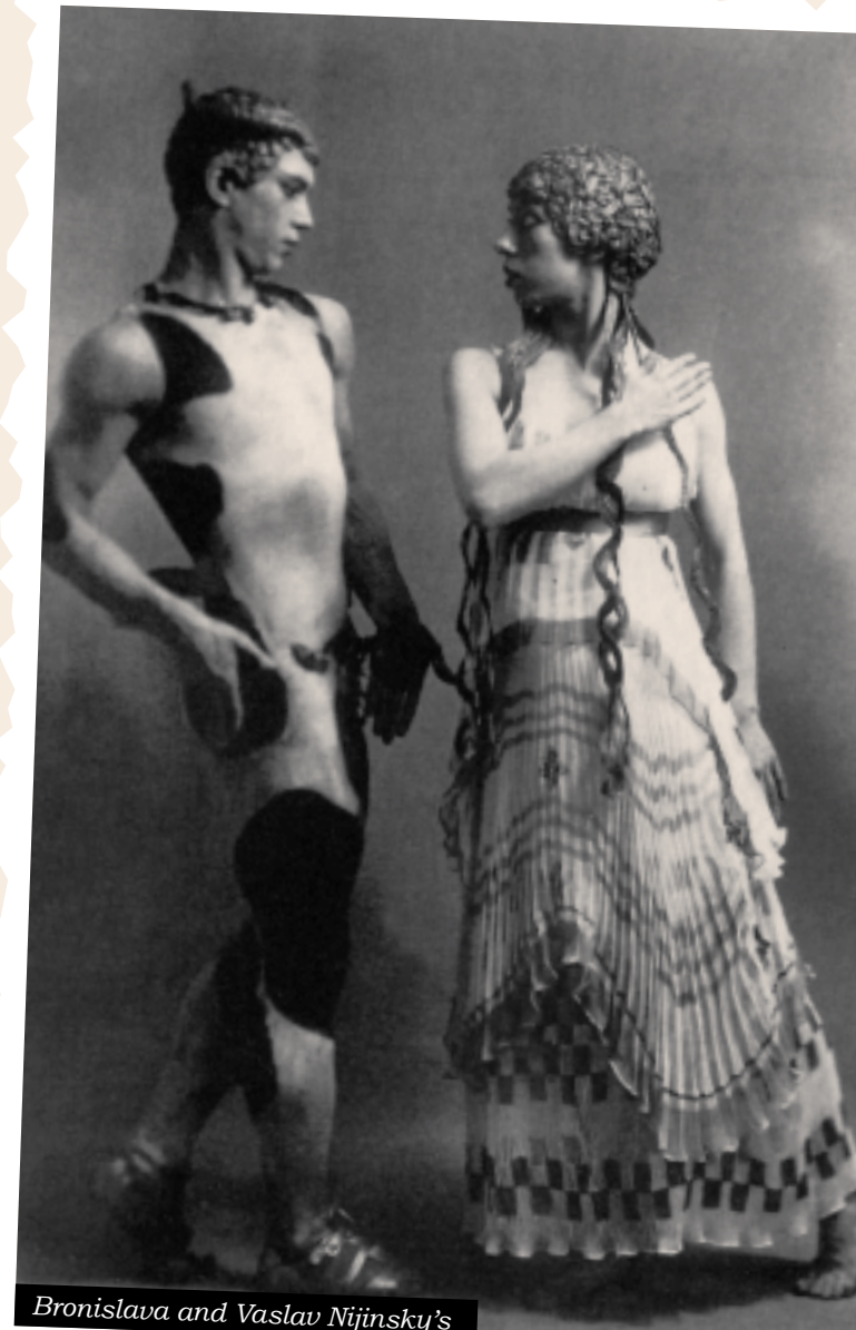
Bronislava and Vaslav Nijinsky's