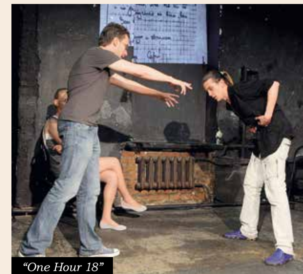
«One Hour 18»