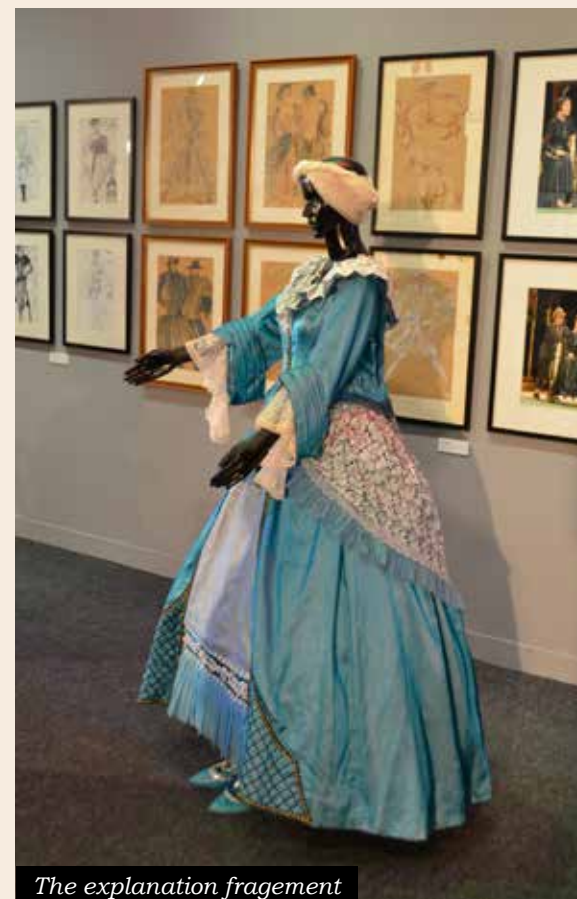
The explanation fragmentation

There was also a fashion parade at the exhibition: the models demonstrated the dazzlingly beautiful costumes from the opera “The Betrothal in a Monastery” in Mariinsky