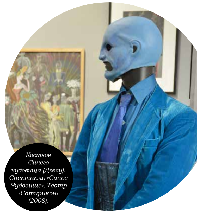
Костюм Синего чудовища (Дзелу). Спектакль «Синее Чудовище», Театр «Сатирикон» (2008).