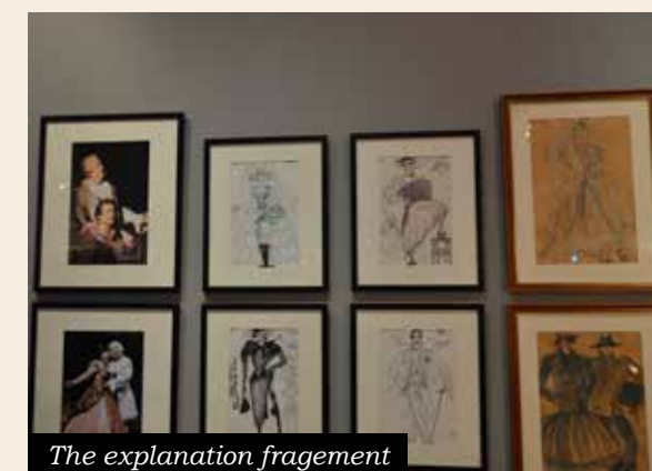
The explanation fragmentation