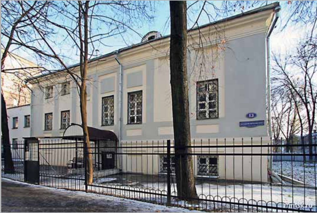
Дом, где провел детство Сухово-Кобылин. Москва, Большой Козловский переулок, 13.