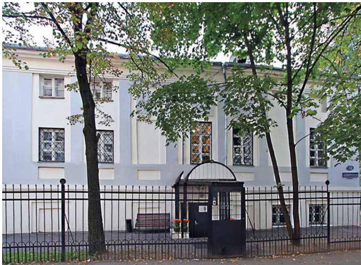
Дом, где провел детство Сухово-Кобылин. Москва, Большой Козловский переулок, 13.

ОН БЛИСТАЛ НА БАЛАХ, МНОГО ВРЕМЕНИ ПОСВЯЩАЛ СКАЧКАМ, ВОЛОЧИЛСЯ ЗА СВЕТСКИМИ КРАСАВИЦАМИ. А НА ДОСУГЕ ИЗУЧАЛ ГЕГЕЛЯ. И ДАЖЕ ПОДУМЫВАЛ О СОЗДАНИИ СОБСТВЕННОЙ ФИЛОСОФСКОЙ СИСТЕМЫ. А В РЕЗУЛЬТАТЕ ОКАЗАЛСЯ В ТЮРЬМЕ.