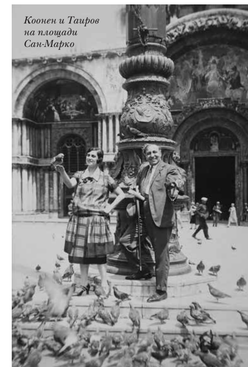
Коонен и Таиров на площади Сан-Марко

Театру тем не менее удалось выступить, он не распался и в новом сезоне благодаря содействию Александры Яблочкиной и Александра Южина открылся в другом здании – в клубе на Большой