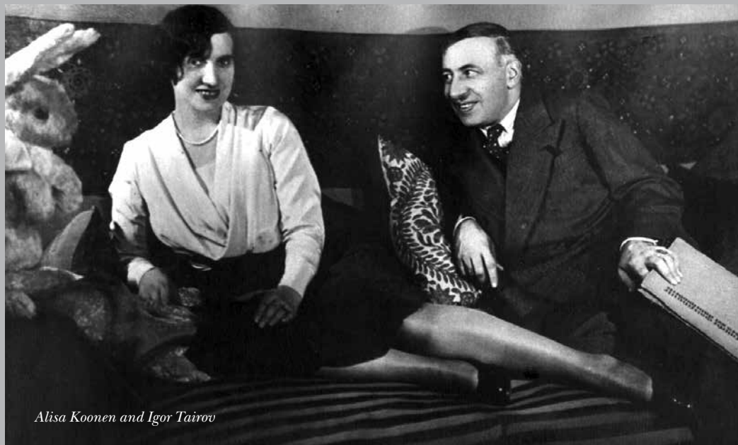
Alisa Koonen and Igor Tairov

Nevertheless, the theatre was able to persevere. It didn't fall apart, and, thanks to the assistance of Aleksandra Yablochkina and Alexander Yuzhin, opened in the new season in a new building – a club on Bolshaya Nikitskaya Street (a house that belonged to the Russian Theatre Society). For several months the theatre lived in a state of uncertainty about its impending fate. Still, thanks to the active assistance of Anatoly Lunacharsky, the Kamerny Theatre was soon given back the building on Tverskoy Boulevard. Later on, and to a large extent due to the support of Lunacharsky as well, the Kamerny Theatre ac-