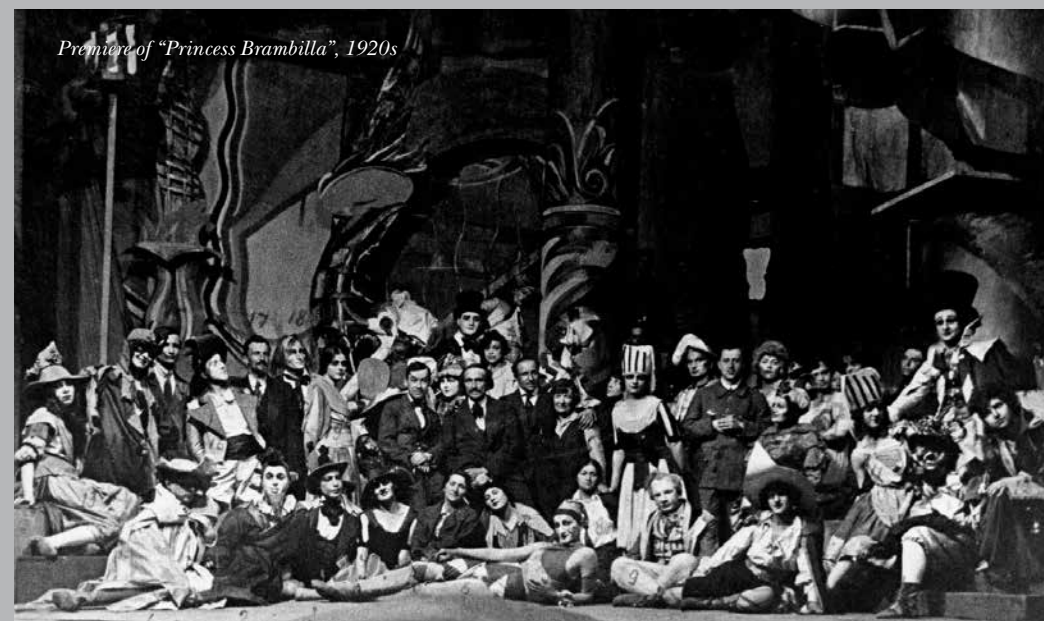
Premiere of "Princess Brambilla", 1920s

tors were able to go on lengthy tours abroad in 1923, 1925 and 1930. The only theatre that could compare with the Kamerny in terms of trips abroad was the Art Theatre. Just to illustrate: the first time Meyerhold and his theatre were allowed to go to Europe was 1930.