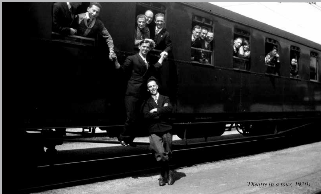
Theatre in a tour, 1920s

The director needed incredible faith in his mission and superhuman powers in order to lead this ship for 35 years, despite the constant reproaches for pretentiousness and aestheticism. Incidentally, one of the reviewers also referred to the theatre as "an aesthetic morgue".