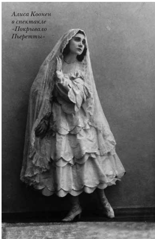
Алиса Коонен в спектакле «Покрывало Пьеретты»

Такова же была температура их существования в творчестве. Таиров и Коонен жили в 100-градусной атмосфере преданности своему театру. Лишённые этого накала, оставшись без Камерного театра, пережив предательство учеников и соратников, Таиров и Коонен чувствовали себя бесповоротно выброшенными из жизни. Прожив в Камерном, в сущности, очень счастливую жизнь, они оказались физически не способными существовать в театре без чувства счастья. После закрытия их Камерного, который был переименован в Театр имени А.С. Пушкина, Таиров прожил чуть больше года, Коонен пережила его почти на четверть века, но ни в какой театральный коллектив войти не захотела – выступала только с чтецкими программами.