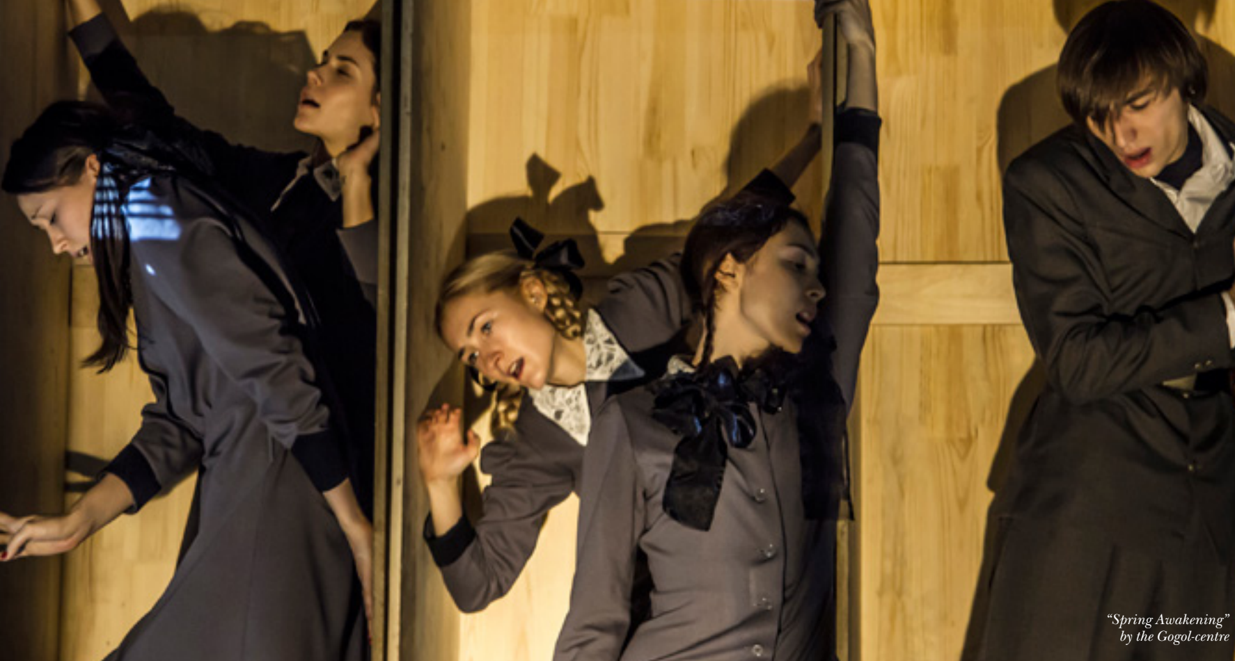
“Spring Awakening” by the Gogol-centre

form to talk about the terrifying events when the German capital was split in half by a wall within a matter of days. A close-knit family returns home after a weekend out in the country and finds before its house a tangible border dividing the two new Germanys. Today’s teenagers must know what it was like for their peers back then, for those who are now grandparents. Gloomy scenes with a Soviet investigator are conducted in Russian and follow the laws of the Stanislavsky System: the female protagonist is forbidden from addressing the audience directly, as she had been doing, justifying it by the fact that actors on “Russian stage” are separated from the audience by an invisible “fourth wall”. A theatre that does not forget about the fact that it is theatre.