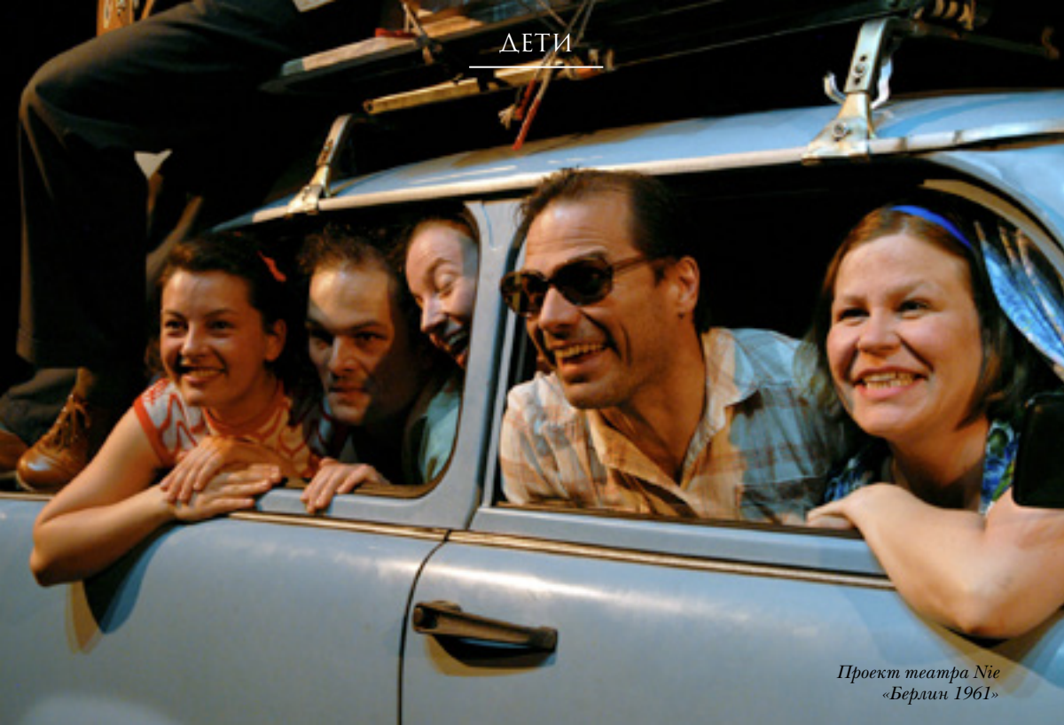
Проект театра Nie «Берлин 1961»