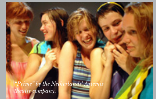
"Prime" by the Netherlands' Artemis theatre company.

HOW RIDICULOUS AND CONTRIVED DO 13-YEAR-OLDS’ PROBLEMS APPEAR WHEN YOU ARE 30, AND HOW INTERESTING AND ESSENTIAL IT IS FOR THOSE 13-YEAR-OLDS TO SEE THEMSELVES AS OTHERS SEE THEM!