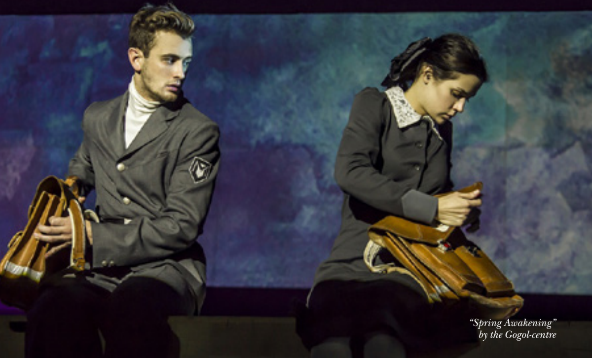
"Spring Awakening" by the Gogol-centre