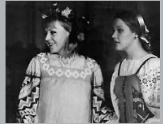
It is impossible to imagine Russian theatre and cinema today without Svetlana Kriuchkova and Elena Proklova