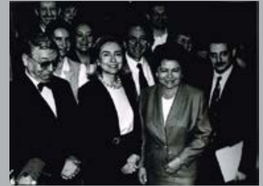
Oleg Tabakov, Hillary Clinton, Naina Eltsina and Alexander Popov after a student performance

she does not have any trouble making the choice and she announces categorically to the prospective students "you will be admitted," "you should go to a different school" – and she is never wrong..