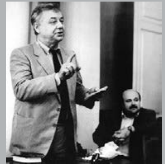
Art directors of acting courses are famous Russian actors Oleg Tabakov and Alexander Kalyagin