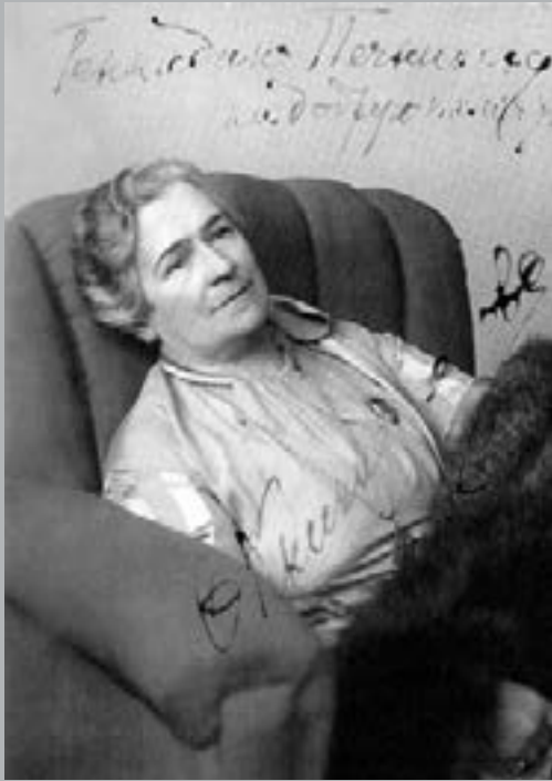
The actress of the Moscow Art Theatre and Anton Chekhov's widow Olga Knipper-Chekhova was among the first professors of Moscow Art Theatre School

power of art), Heinrich Boll, David Samoylov, Robert Rozhdestvensky. That tradition continues to this day.